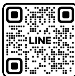
MyoLift JAPAN 公式ライン